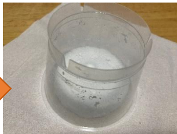
プリンカップを かえ ひっくり返して