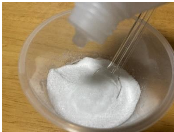
ざいりょう 材料をかきまぜ、 かた 固める