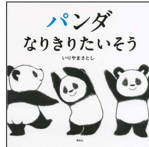
『パンダなりきりたいそう』 P/I いりやま さとし/作 講談社 2016