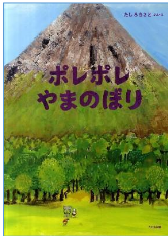
『ポレポレやまのぼり』 P/夕 たしろ ちさと/ぶん・え 大日本図書 2011