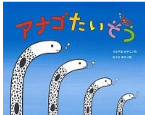
『アナゴたいそう』 P/M うさやま みやこ/作 みうら あ や/絵 鈴木出版 2018