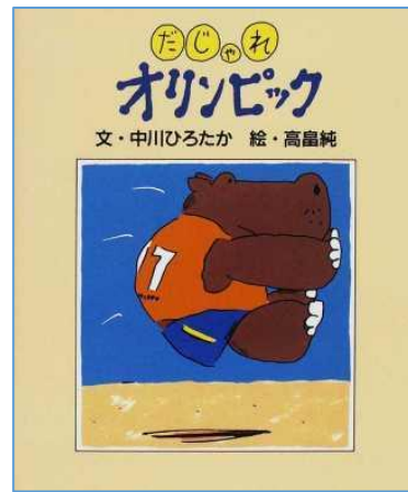
『だじゃれオリンピック』 P/夕 なかがわ ひろたか/ぶん 高畠 純/絵 絵本館 2008