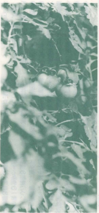
豊田地区のトマト栽培

第4は、市民の強い要望から優先的に予算措置が行われるべき事業が全くこの予算書には見当たらない。例えば、ふるさと博物館建設、大成荘の改築、第五小の建替え、生活保健センター建築、二番橋の建設、南平用水用地買収費等があげられます。 以上により本予算は、修正案提出の対象にすらならない欠陥予算であり原案に反対するものです。