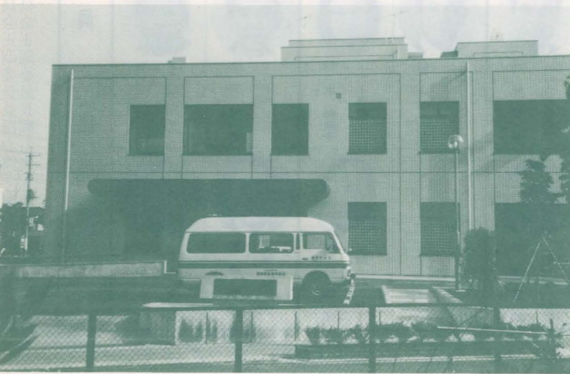
開設された「つばき学園」

1、週一時間の授業を行ってあります。又学校生活を通して徳性の陶冶に努めています。