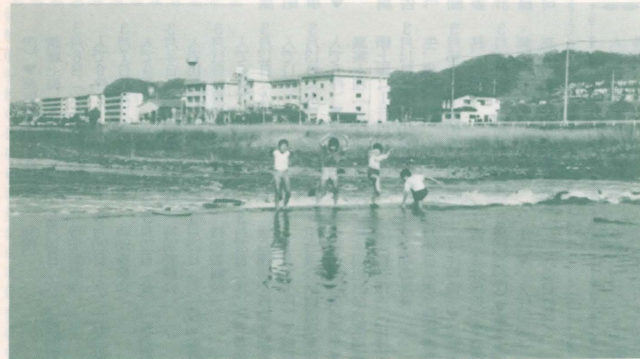
浅川にあそぶ子供達

問1、調査項目の変更について下水道等の質問がなくなり情報公開制度がつけ加えられたが民間委託などの質問がなぜ加えられなかったのか。 2、南部地域の医療施策の遅れについて市長はどの様に反省しているのか。 3、調査結果を基に福祉施策の経費負担はどうするのか。 答 企画財政部長 1、5年の間に市民意識に変化が出てきました。現時点では調査項目に「民間委託」は入れる必要を認められません。