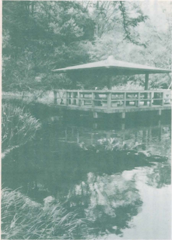
新緑の清水谷公園

市長から「昭和60年度予算の編成方針と事業について」の表明がされ、続いて行政報告がなされた。前者は9名、後者は8名の議員から質疑が展開された。その後諸般の報告がなされた。