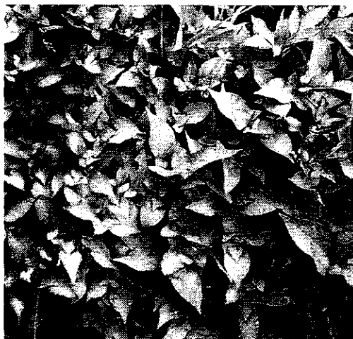
「石田散葉」の原料ミゾソバ(牛革草)